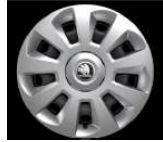
Llanta de acero 35cm (14")