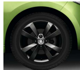
Llanta de Aleación 38cm (15") "CRUX BLACK"