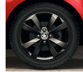
Llanta de Aleación 38cm (15") "AURIGA BLACK"