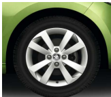
Llanta de Aleación 38cm (15") "CRUX"