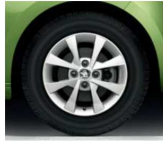
Llanta de Aleación 35cm (14") "APUS"