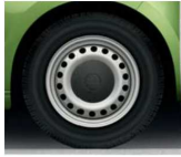
Llanta de acero 35cm (14")