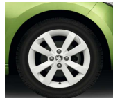
Llanta de Aleación 38cm (15") "CRUX WHITE"