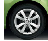
Llanta de Aleación 38cm (15") "AURIGA"