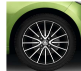
Llanta de Aleación 41cm (16") "SERPENS ANTRACITA"