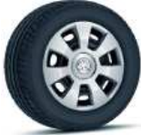
FLAIR (14") serie en ACTIVE