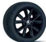
VIGO BLACK 41cm (16") AMBITION / STYLE con Color Concept