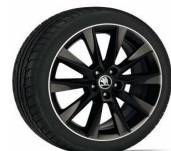
SAVIO 43cm (17") MONTE CARLO