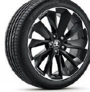
SUPERNOVA BLACK de 48cm (19") Neumáticos 235/40 Opcional en SPORTLINE