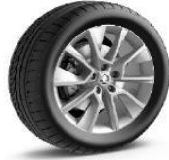
PRAGA de 46cm (18") Neumáticos 235/45 Serie en SCOUT