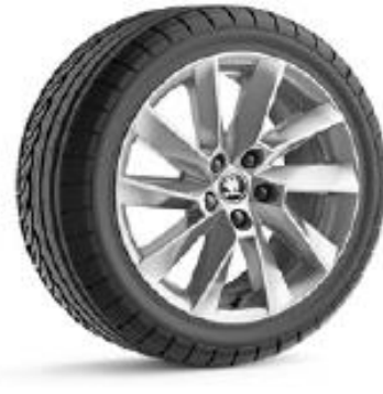
STRATOS de 43cm (17") Neumáticos 215/55 De serie en AMBITION