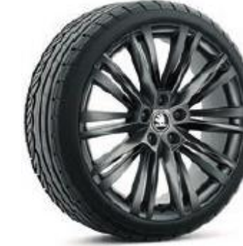
CANOPUS BLACK de 48cm (19") Neumáticos 235/40 Opcional en STYLE y L&K