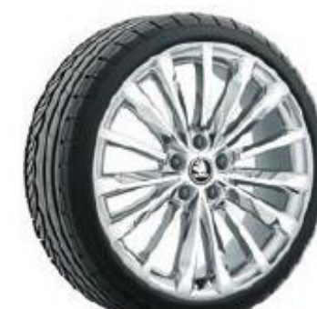
TRINITY super lustrosas de 48cm (19") Neumáticos 235/40 Opcional en L&K