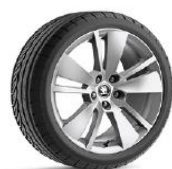
ZENITH de 46cm (18") Neumáticos 235/45 Opcional en AMBITION y STYLE