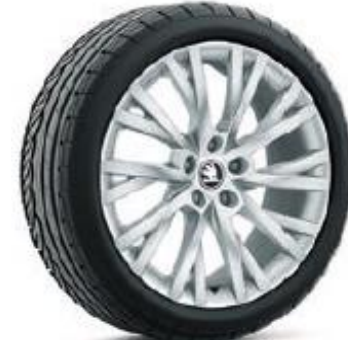
ANTARES de 46 cm (18") Neumáticos 235/45 Opcional en AMBITION e incluida en Pack Style