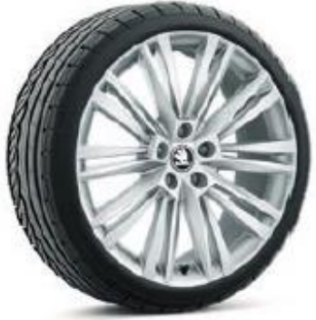
CANOPUS de 48cm (19") Neumáticos 235/40 Opcional en AMBITION, STYLE y L&K