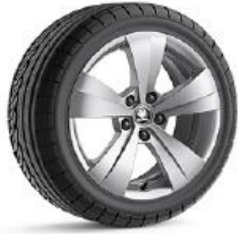
TRITON de 43cm (17") Neumáticos 215/55 R17 Opcional en ACTIVE, AMBITION y STYLE