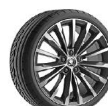
TRINITY ANTRAZITA de 48cm (19") Neumáticos 235/40 Opcional en L&K