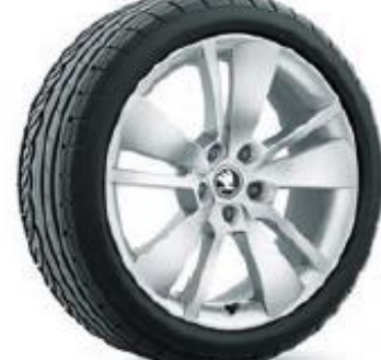
ZENITH de 46cm (18") Neumáticos 235/45 Serie en SPORTLINE