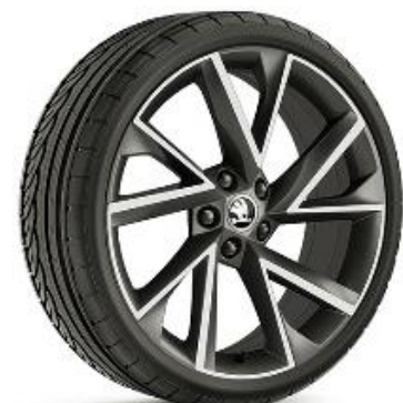
VEGA ANTRAZITA de 48cm (19") Neumáticos 235/40 Incluida en Pack Sportline