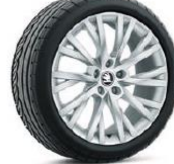
ANTARES de 46 cm (18") Neumáticos 235/45 De serie en L&K