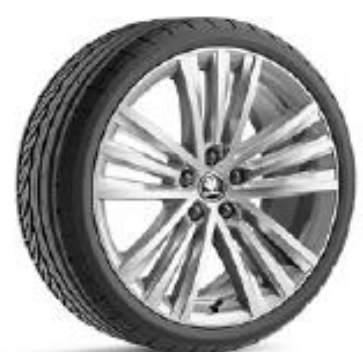
SIRIUS PULIDA de 48cm (19") Neumáticos 235/40 Opcional en AMBITION y STYLE