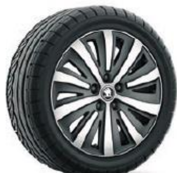
DRAKON de 43cm (17") Neumáticos 215/55 Opcional en ACTIVE y AMBITION