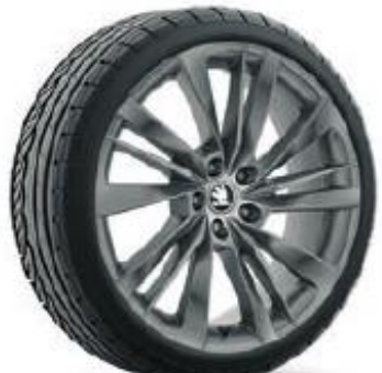
ACAMAR ANTRACITA de 48cm (19") Neumáticos 235/40 Opcional en AMBITION y STYLE