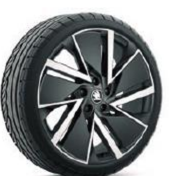
VEGA AERO BLACK de 48cm (19") Neumáticos 235/40 Opcional en AMBITION, STYLE, L&K