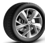
TRIGLAV de 48cm (19") Neumáticos 235/50 R19 Opcional desde Ambition