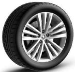
SIRIUS de 48cm (19") Neumáticos 235/50 R19 Opcional desde Ambition