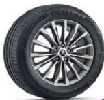
TRINITY Antrazita de 46cm (18") Neumáticos 235/55 R18 Opcional desde Ambition