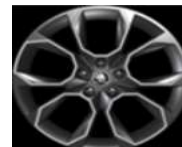
XTREME de 20" Neumáticos 235/45 R20 De serie en RS