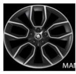
CRATER de 48cm (19") Neumáticos 235/50 R19 Opcional en SCOUT