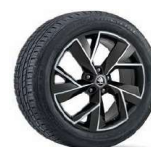
TRIGLAV Negro Brillante de 48cm (19") Neumáticos 235/50 R19 Opcional desde Ambition