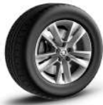
MITYKAS de 43cm (17") Neumáticos 215/65 R17 De serie en ACTIVE