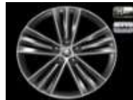
SIRIUS ANTRAZITA de 48cm (19") Neumáticos 235/50 R19 De serie en L&K