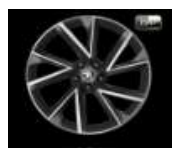
VEGA de 20" Neumáticos 235/45 R20 Opcional en SPORTLINE