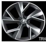
TRIGLAV de 48cm (19") Neumáticos 235/50 R19 De serie en SPORTLINE