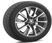
PRAGA de 48cm (19") Neumáticos 235/50 R19 De serie en SCOUT