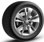
TRITON de 46cm (18") Neumáticos 235/55 R18 De serie en STYLE