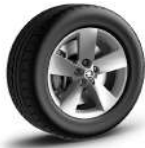
RATIKON de 43cm (17") Neumáticos 215/65 R17 De serie en AMBITION