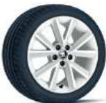
VIGO WHITE 41cm (16") AMBITION / STYLE con Color Concept