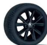
VIGO BLACK 41cm (16") AMBITION / STYLE con Color Concept