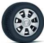
FLAIR (14") serie en ACTIVE