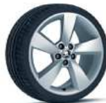
CAMELOT 43cm (17") AMBITION / STYLE