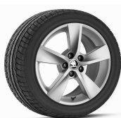
EVORA 41cm (16") AMBITION / STYLE