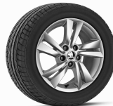
CYGNUS (15") serie en STYLE