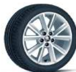
VIGO 41cm (16") AMBITION / STYLE con Color Concept