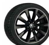
SAVIO 43cm (17") MONTE CARLO