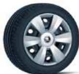
DENTRO (15") serie en AMBITION