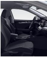
STYLE (serie) BG