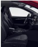
RS (ALCANTARA) LI (gris) + PWF + 4N1 + PW5