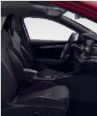
RS (serie) LH (rojo)