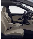
STYLE (SUECIA/CUERO) CB + 5MN + PBI