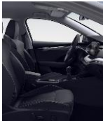
STYLE (CUERO) BG + WE1