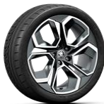
ALTAIR Antrazita de 48cm (19")