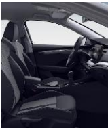
AMBITION + STYLE (CUERO) BG + WEE