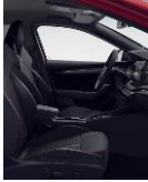
RS (ALCANTARA) LH (Rojo) + PWF + PW5