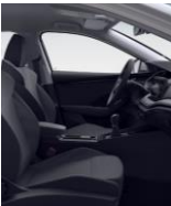
AMBITION (serie) BG