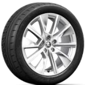
PRAGA de 46cm (18")