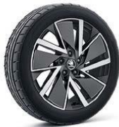
VEGA AERO de 46cm (18")