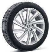
PERSEUS de 46cm (18")