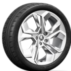
ALTAIR de 48cm (19")