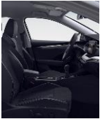
STYLE (SUECIA/CUERO) BG + PBF/WE3