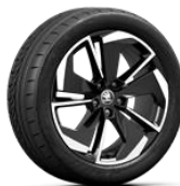
COMET negra Antrazita de 46cm (18")