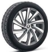
PERSEUS Antrazita de 46cm (18")