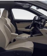
STYLE (BEIGE) CB + WE4