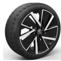
VEGA Aero (7x18")

Opcional para Ambition &amp; Style &amp; Sport