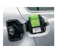
Rascador de hielo