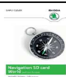
Tarjeta SD Cards para mapas de Navegador Amundsen