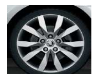
Llantas de aleación 7.0J x 17" 205/50 CRYSTAL