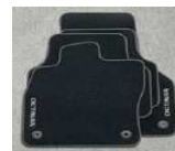
Alfombrillas de tela PRESTIGE