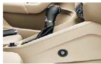
Sistema de bloqueo para transmisión manual y para transmisión automática