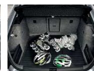
Moqueta reversible (lado goma)