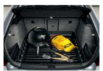
Bandeja de plástico para octavia (para Octavia Combi)