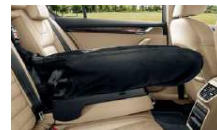
Bolsa para esquís