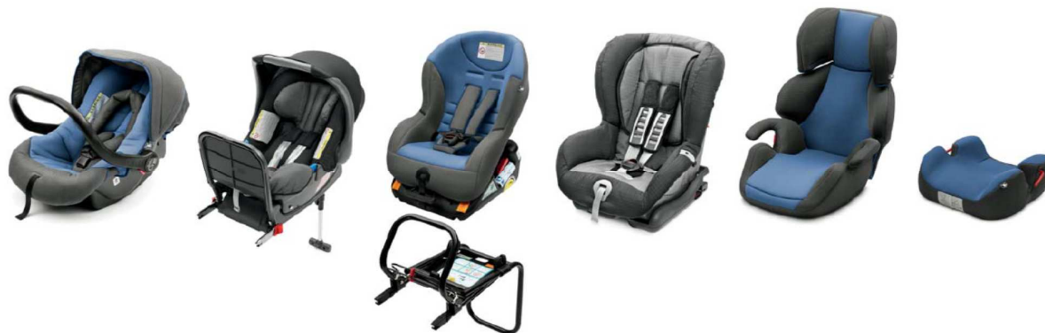
Sillita infantil One Plus de 0-13 kg.