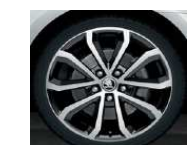
Llantas de aleación 7.0J x 17" HAWK efecto bicolor (plata-negro)