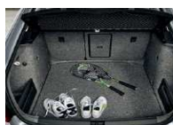
Moqueta reversible (lado tela)