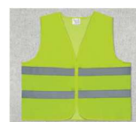
Chaleco de seguridad