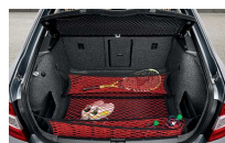
Redes en el maletero; en negro y en rojo