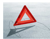
Triángulo de seguridad