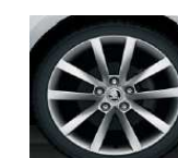
Llantas de aleación 7.0J x 17" ALARIS