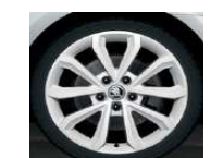
Llantas de aleación 7.0J x 17" HAWK