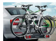
Portabicicletas para remolque