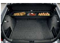
Caja multifuncional bajo bandeja del maletero