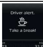
Detector de Fátiga