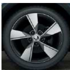
NIVALIS ANTRAZITA (7x17")