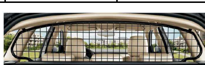
Rejilla para Octavia Combi