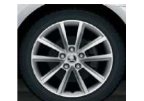
Llantas de aleación 7.0J x 17" TERON