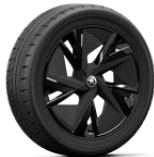
TAURUS 235/50 R20 del - 255/45 R20 tras * Solo disponible para versión SPORTLINE