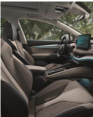
LODGE EL+PLA EQU IPA MIE NTO 804 / Spor tline 80