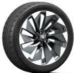
SUPERNOVA 235/45 R21 del - 255/40 R21 tras