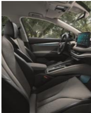
LOFT (serie) EO