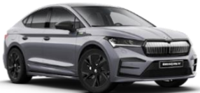
GRIS CUARZO F6F6