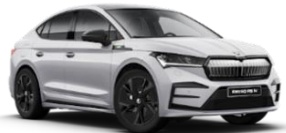
PLATEADO BRILLANTE 8E8E