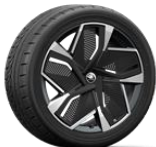
VISION 235/45 R21 del - 255/40 R21 tras * Solo disponible para versión RS