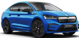
AZUL RACE 8X8X

Pintura uniforme (K4K4) Pintura metalizada