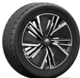
NEPTUNE 235/50 R20 del - 255/45 R20 tras