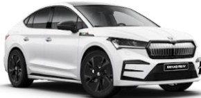
BLANCO LUNA 2Y2Y