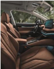
ECO SUITE EK+PLB