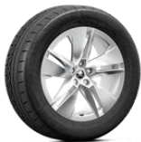
PROTEUS 235/55 R19 del - 255/50 R19 tras