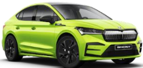
VERDE MAMBA I3I3