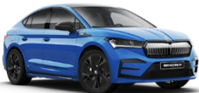
AZUL ENERGY K4K4