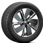
REGULUS ANTRACITA 235/55 R19 del - 255/50 R19 tras